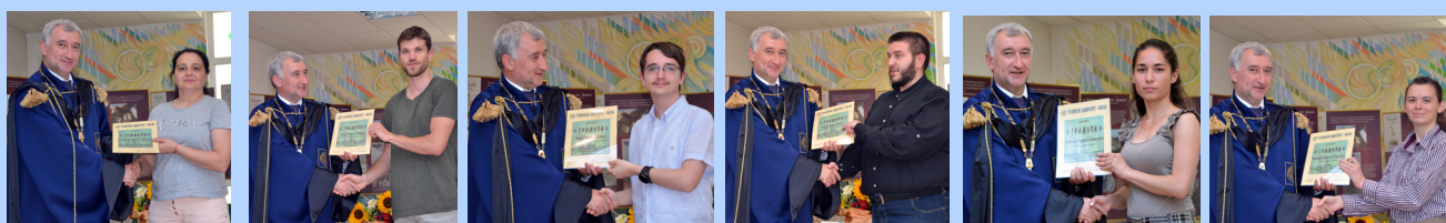
Награждаване на студенти и преподаватели, тържествен Академичен съвет 19 май 2022 г.

Поздравявам Технически университет – Габрово от името на Университета за приложни науки в Шмалкалден.”