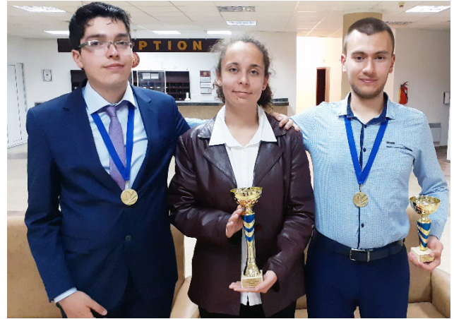
Отборът на Технически университет – Габрово при участието му в НСОМ 2022

От 2010 г. НСОМ се провежда с любезното съдействие на Министерството на образованието и науката, а дългогодишен спонсор на олимпиадата е Фондация „Еврика“. Участващите студенти се разпределят в три състезателни групи според професионалното направление, в което е специалността им.