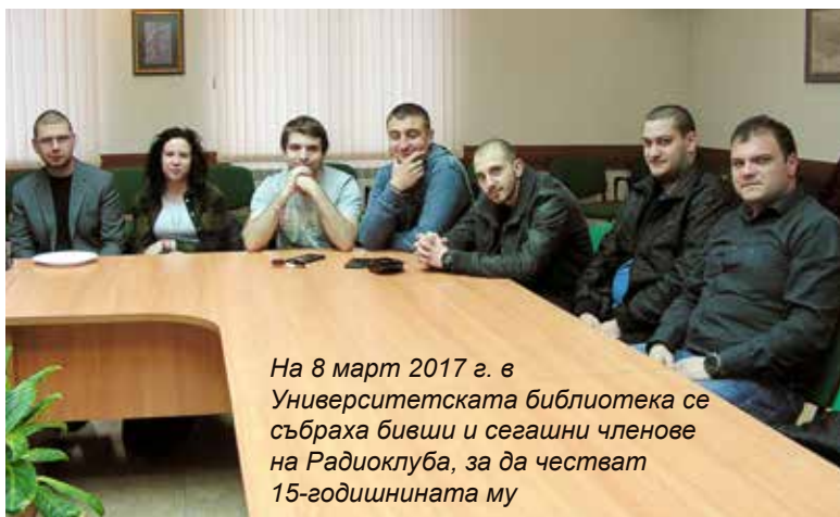
На 8 март 2017 г. в Университетската библиотека се събраха бивши и сегашни членове на Радиоклуба, за да честват 15-годишнината му