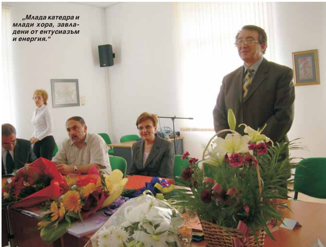
„Млада катедра и млади хора, завладени от ентузиазъм и енергия.“

С „Добре дошли“, поздрави присъстващият доц. Тошко Ненов, ръ-